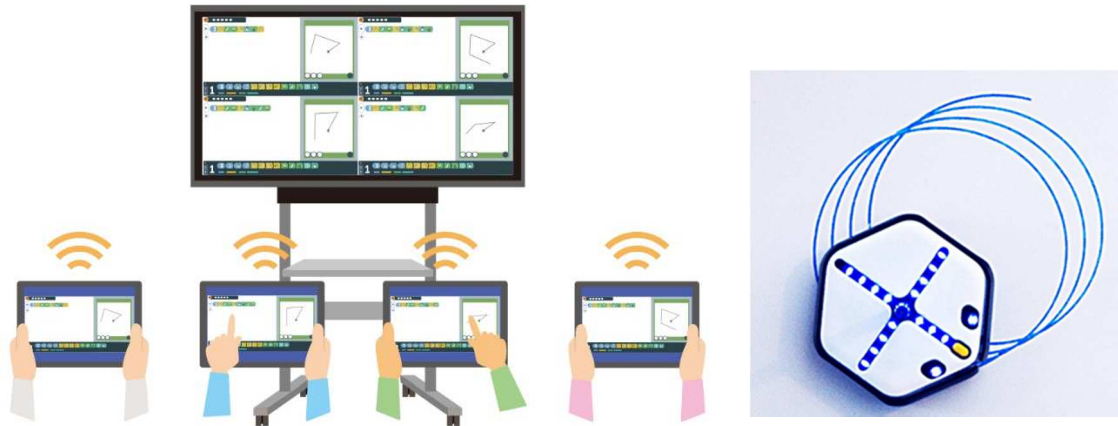
授業支援ソフト xSync Classroom