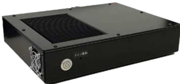
作業支援システム「VisualCheckEye (ビジュアルチェックアイ)」

当社の連結子会社である株式会社タイテックが、画像処理技術を活用した作業支援システム「VisualCheckEye (ビジュアルチェックアイ)」を2020年10月1日から販売を開始しますので、下記のとおりお知らせいたします。