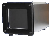
赤外線放射ユニット(温度校正装置)