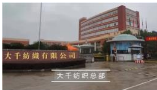
中国大手企業の工場