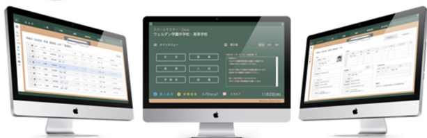
私立小中高校向けトータル校務システム スクールマスターZeus