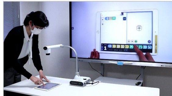
手元を映しながらタブレットの操作方法を教える