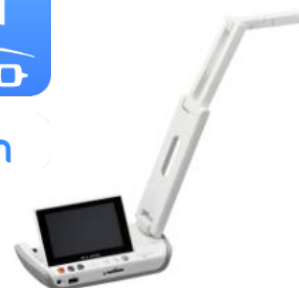
書画カメラ (MA-1) に搭載