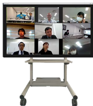
電子黒板 (xSync Board/ELMO Board) に搭載