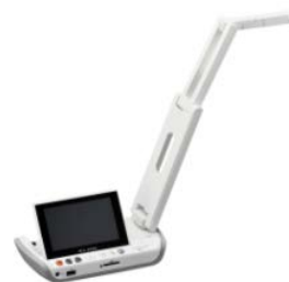
書画カメラ(MA-1)に搭載