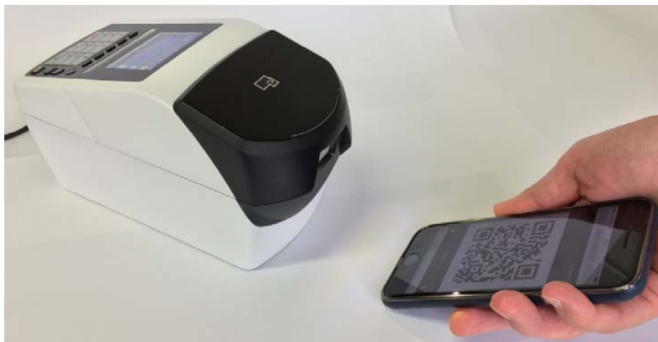
QRコードの読み取り