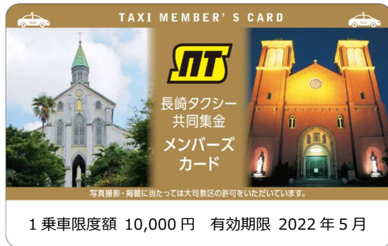
[メンバーズカード]