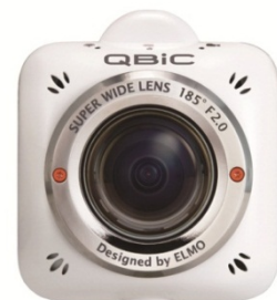
QBiC MS-1 (販売中)

QBiC Panorama は、最大画角 185° の超広角レンズを搭載した QBiC MS-1(キュービック エムエスワン) 4 台を専用リグ(取付部品)に取り付け、簡単に上下 180° 左右 360° のパノラマ動画を撮影する業務用カメラシステムです。