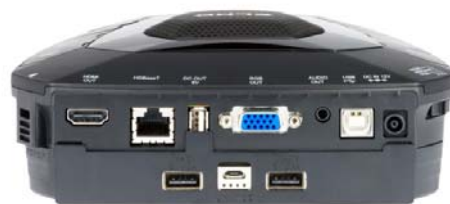
専用バッテリー装着時

詳細につきましては、添付資料「株式会社エルモ社 プレスリリース：Huddle Space G1/G2/G3」をご参照ください。