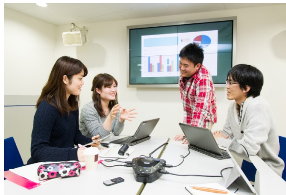
アクティブ・ラーニング