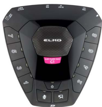
Huddle Space G1