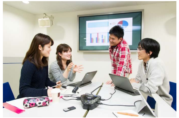
アクティブ・ラーニング