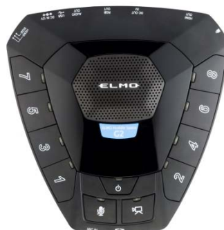
Huddle Space G2