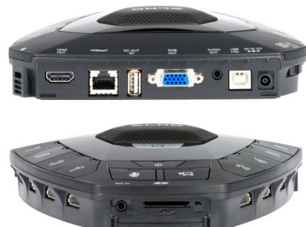
インターフェース部