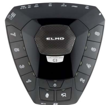
Huddle Space G3