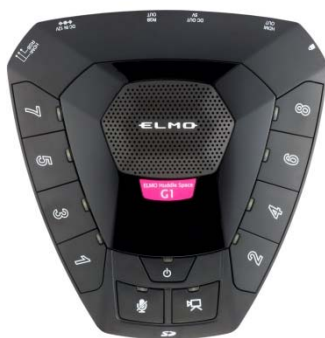
Huddle Space G1