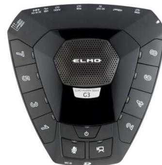
Huddle Space G3