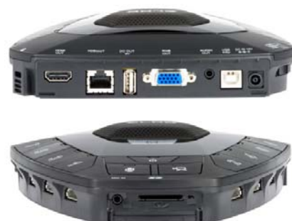
インターフェース部