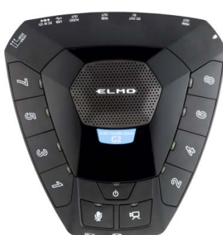
Huddle Space G2