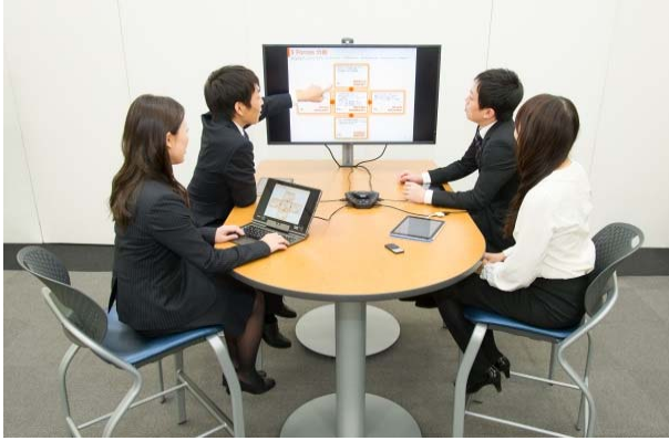
ハドルミーティング