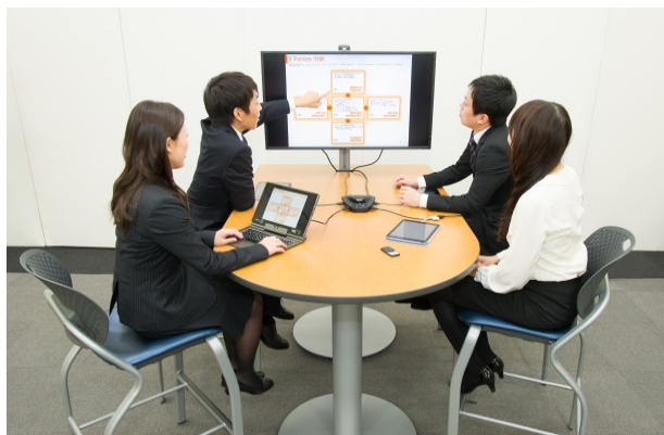
ハドルミーティング