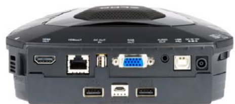
専用バッテリー装着時